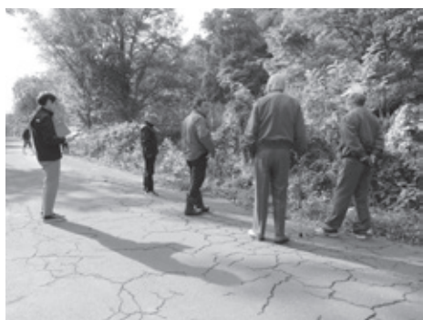
→千走地区用水路の視察

また、他の地区の農業用水路についても、今後の利用状況等を踏まえ、整備を検討されたい。