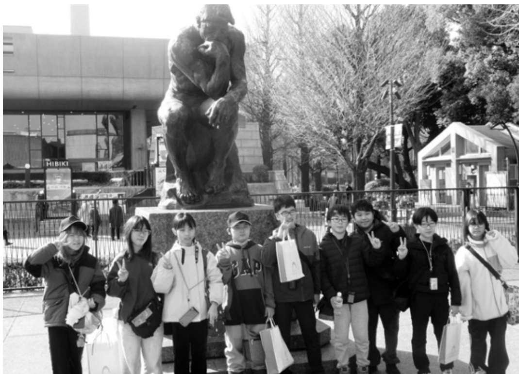
▲ - 1月13日～16日 - 小学生国内視察研修

■議会広報「かりば192号」をお届けします。 本号では、第4回定例会の審議内容、一般質問の内容を中心に編集しました。 ぜひご覧になって、村の方針や議会活動にご理解を深めていただきたいと思います。