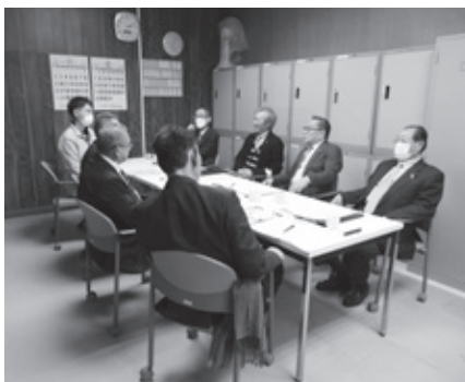
→ エアコン設置箇所の説明

・年次的な計画を立て、順次施設へのエアコン設置を進められたい。 また、役場庁舎及び保育所ホールを優先し設置を進められたい。