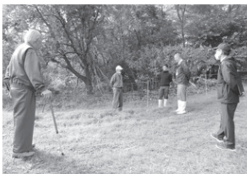
→電気柵設置状況の視察

・全国的にクマによる人身被害が深刻な状況となっており、本村でも民家周辺でのヒグマの出没が年々増加していることから、草刈や放棄された果樹等の伐採、電気柵の適切な維持管理、新規設置要望等にも柔軟に対応し、出没情報についても住民等への注意喚起を促すため迅速に周知されたい。