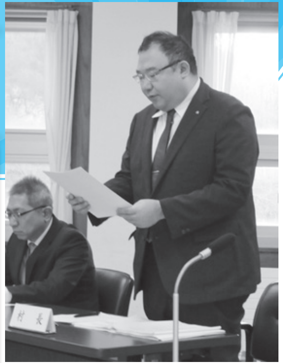
▲ 行政報告する夏井村長

その後、総務社会・産業建設の各常任委員長から、所管事務調査について報告がありました。そのほか報告2件を受け、議案13件を何れも原案のとおり可決、閉会中の継続調査1件を決定し、会期を1日残し閉会しました。