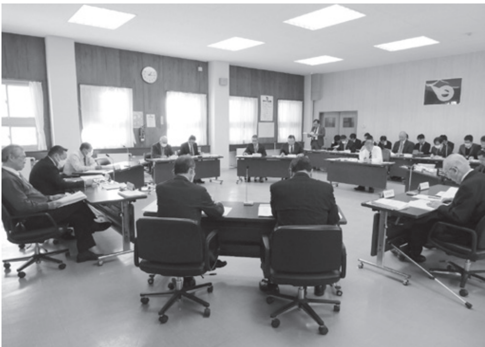
— 12月10日 — 第4回村議会定例会

島牧村議会も昔から教育予算については寛容な議会だったと思えますね、その辺もう一度様々な形でなるべく子ども達に我々は積極的な支援してるんだというご姿勢をお示しただきますようお願い申し上げます。終わりたいと思います。