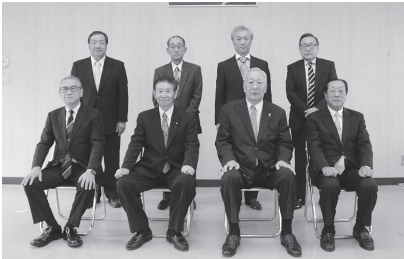
村議会議員選挙当選証書授与式を終えて