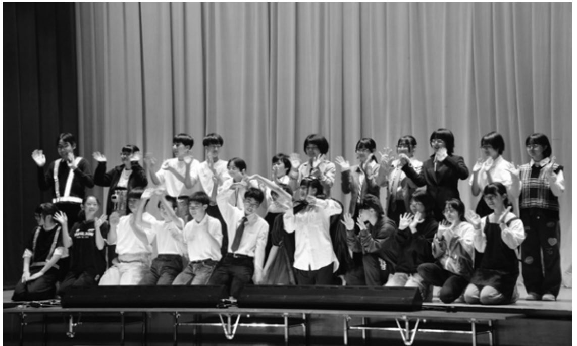
▲ 島牧中学校学校祭（10月4日）

■議会広報「かりば191号」をお届けします。 本号では、第3回定例会の審議内容、一般質問の内容と議会議員選挙後の新たな議会構成を中心に編集しました。 ぜひご覧になって、村の方針や議会活動にご理解を深めていただきたいと思います。