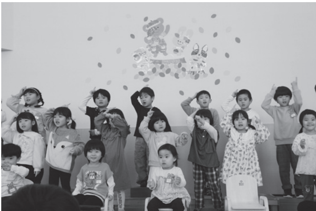
島牧保育所発表会 (11月15日)