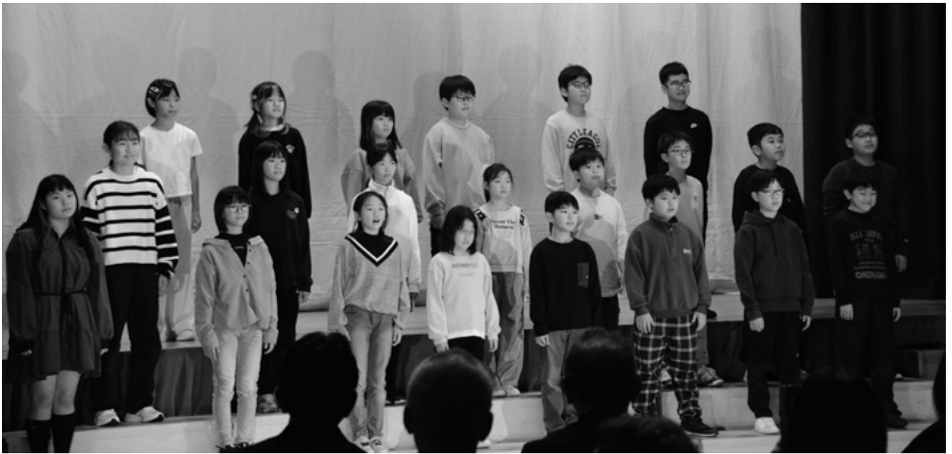
島牧小学校学芸会（10月25日）