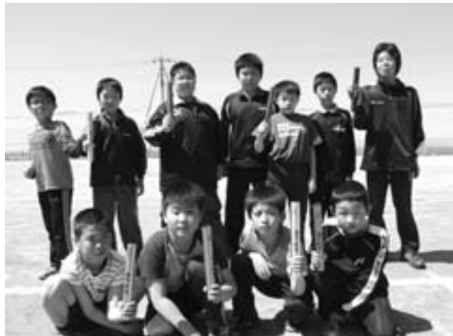
全力疾走と書いてあるバトンを手に喜ぶ子供たち

一人ひとりの力は小さいかもしれませんが、リレーのように力を合わせて、心を繋いでいけば、“より良い明日の北海道、そして明るい社会の創造”というゴール（目標）に必ず辿りつくと、私は信じています。このバトンに触れたときに、私はそんな想いが、皆さんに伝われば本当に幸せなことです。