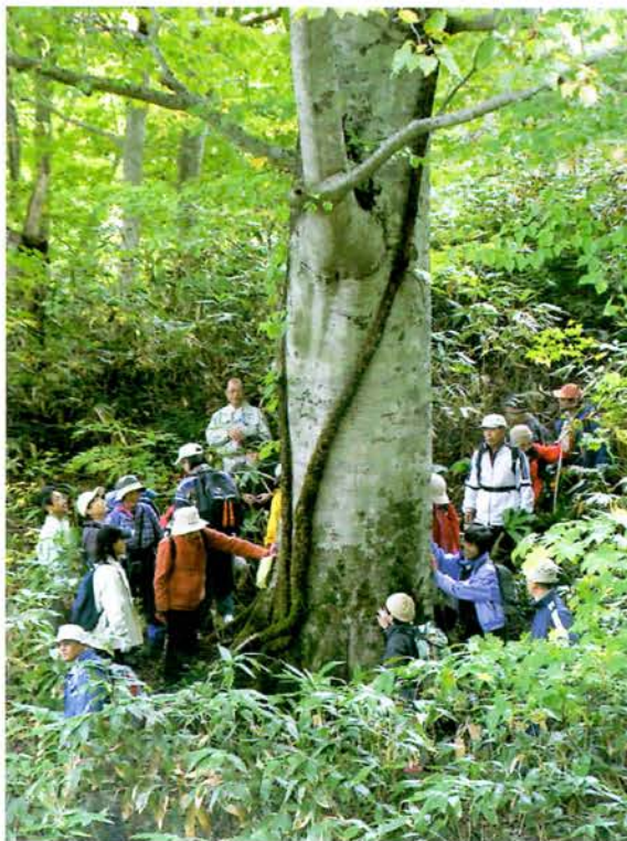
大きなブナの木に驚く参加者

シンボリックな大きなブナの見学では、直径110cm高さ30mの話に「ワァーすごい」と驚きの声上がり、見上げる人、触ってみる人、カメラに収める人など反応は様々。この日は天候に恵まれ、魅力的な自然にふれていました。