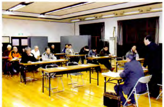
11/30 永豊・泊・豊平地区の『むらづくり懇談会』の様子