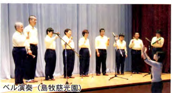
ベル演奏(島牧慈光園)