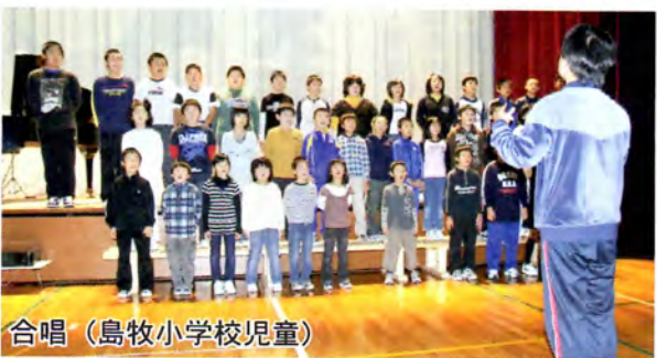
合唱(島牧小学校児童)