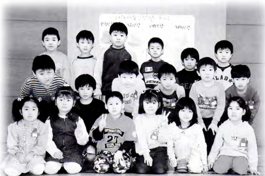
4月から小学校に入学する子ども達

なお、つぎの名簿からもれているお子さんや、現住所の変わっているお子さんがいましたら、至急教育委員会学校教育係にご連絡ください。 TEL 75-6211 内線62