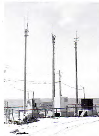
▲3月1日より供用開始した栄浜中継局

中継塔は3本で、高さはいずれも15メートルのコンクリート製、NTTドコモ、エーユー、Jフォンの3社に1本ずつ割り当てられています。