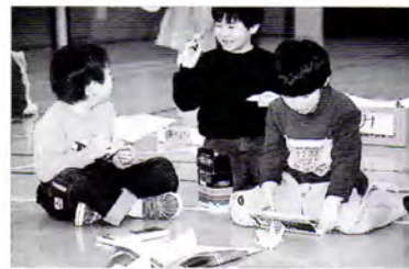
▲一日入学で紙ひこうきづくり