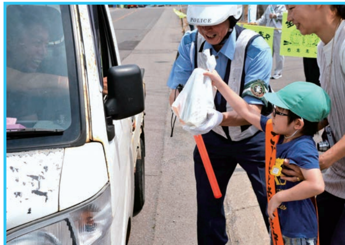
元気な声で「交通安全おねがいします！」 (7/11 撮影)