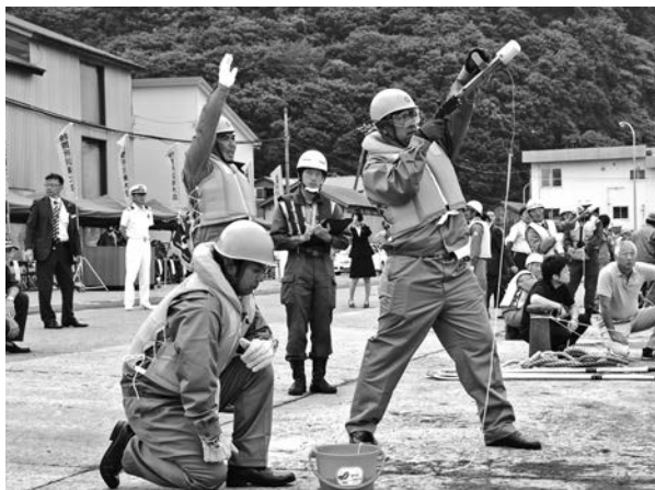
▲救命索発射器操法

海上における人命および財産を守るため、各救難所の所員は真剣な面持ちで訓練に臨んでいました。