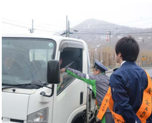
▲ 4月6日、交通安全街頭啓発の様子 ◀ ドライバーに安全運転を呼びかけました