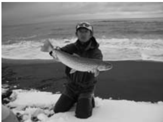
大きめのアメマスをゲット 23. 12. 29

島牧恒例のイベント、アメマスダービーが島牧海岸を会場に12月17日から3月25日まで行われています。