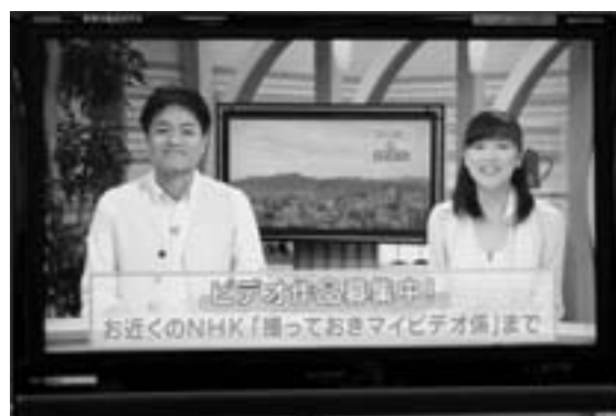
現在のデジタル放送の画質