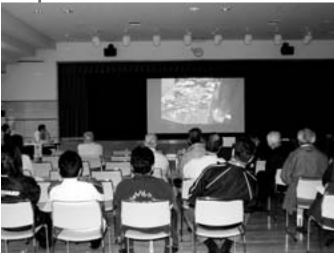
ビデオを使用して説明

改めて現地の惨状に驚くと共に、未だに普段の生活に戻れない被災者の事を案じている様子がうかがえました。