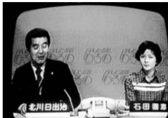
昭和55年の大幹線施工後の画質 改良され当時としては、きれいな画面だった...

昭和45年からテレビの難視聴対策と維持管理を事業として取り組んできたテレビ組合連合会は、平成20年度村が実施した光ネットワーク工事の完了に伴い、アナログ放送設備としての役目が終了したことから各業務の整理を行い、4月16日開催された解散総会で長い歴史に幕を下ろしました。