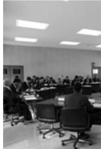
議案を審議する議会のような様子