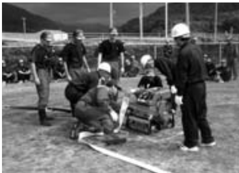
訓練に励む消防団員