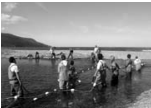
採卵するためサケの捕獲

● 村道等除排雪事業 2,090万4千円 村道や公共施設の除雪・排雪を民間業者に委託し、通行や利用に支障がないようにします。