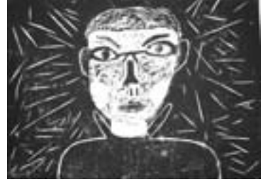
中2 鷹島 健斗