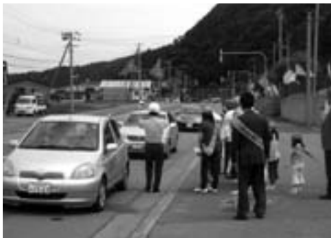
交通安全街頭啓発