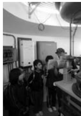
灯台の仕組みを学ぶ