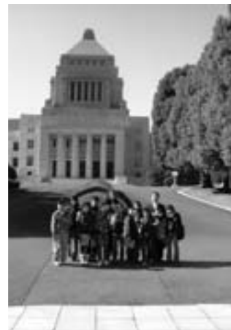
毎年実施されている5年生の国内研修